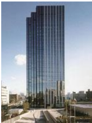
大阪中之島合同庁舎